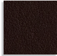
TESTA DI MORO